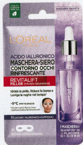
Booster anti fatica all'acido ialuronico, Maschera-Siero Contorno Occhi Rinfrescante Revitalift Filler L'Oréal Paris (3,99 euro).