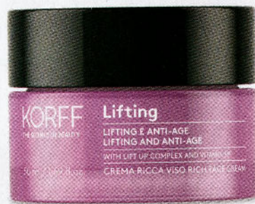
Lift Up Complex e niacinamide distendono i tratti e compattono i tessuti, Crema Ricca Viso Lifting 40-76 Korff (69 euro).